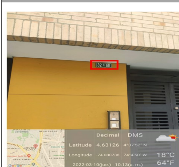
Foto No. 1 Nomenclatura urbana del predio ubicado en la calle 30 No. 32 A -68 donde se encuentra colocado el aviso publicitario haciendo alusión a la candidata SOLEDAD TAMAYO TAMAYO