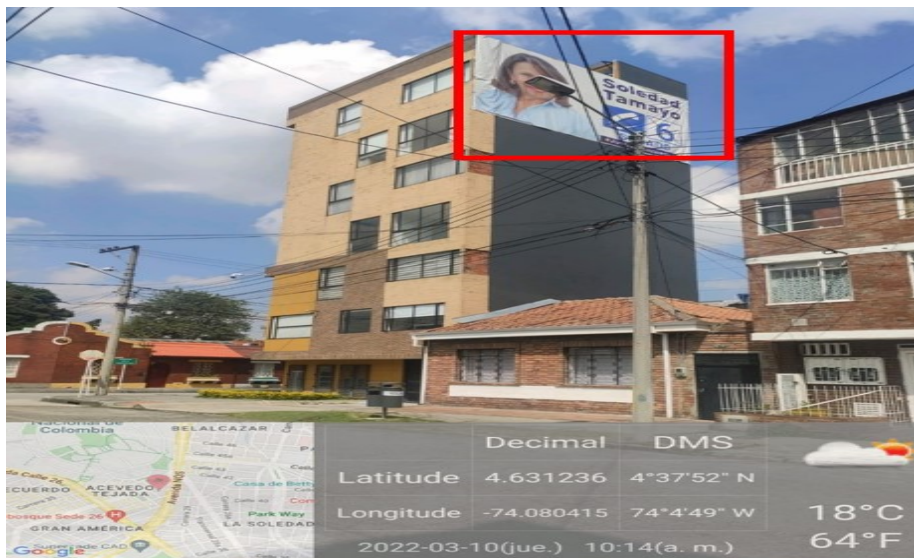
Foto No. 2. Vista panorámica del inmueble en la cual se evidencia un elemento tipo AVISO EN FACHADA ubicado en la culata del edificio haciendo alusión a la candidata por el senado SOLEDAD TAMAYO TAMAYO del partido CONSERVADOR COLOMBIANO .