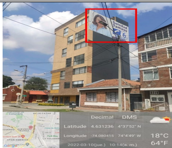
Foto No. 2. Vista panorámica del inmueble en la cual se evidencia un elemento tipo AVISO EN FACHADA ubicado en la culata del edificio haciendo alusión a la candidata por el senado SOLEDAD TAMAYO TAMAYO del partido CONSERVADOR COLOMBIANO .